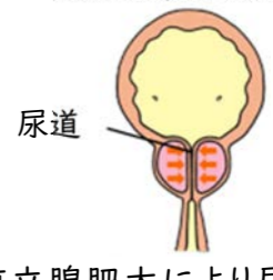
前立腺肥大により尿道が 圧迫される。尿が出にくくなる