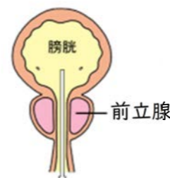
尿は正常に排出される