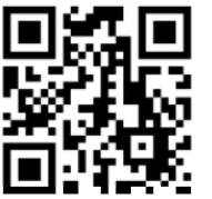
藤本農園さん webサイト